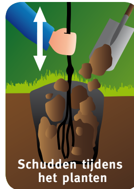
Schudden tijdens het planten