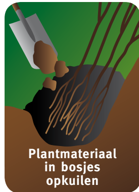
Plantmateriaal in bosjes opkuilen