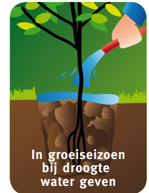
In groeiseizoen bij droogte water geven