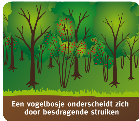
Een vogelbosje onderscheidt zich door besdragende struiken