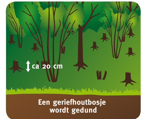
Een geriefhoutbosje wordt gedund