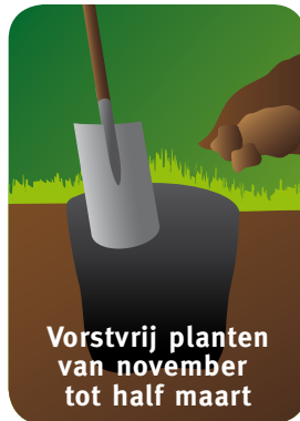
Vorstvrij planten van november tot half maart