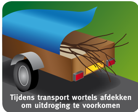
Tijdens transport wortels afdekken om uitdroging te voorkomen